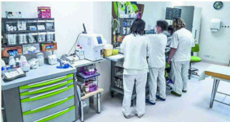
Foto generica di infermiere

21 Maggio 2026 alle 18:56 | 1 minuti di lettura