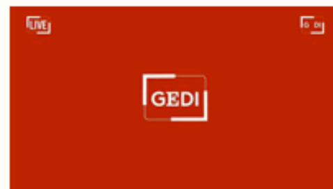
A Roma e Milano i presidi per gli attivisti della Flotilla maltrattati da Israele - diretta